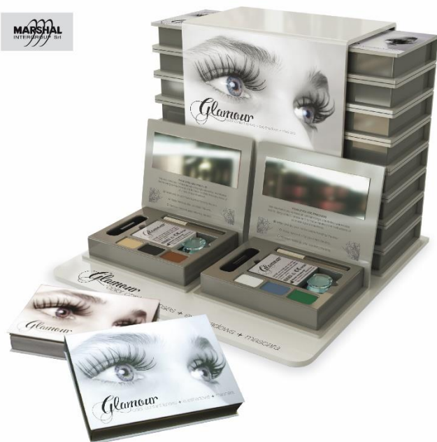
set di 2 lenti a contatto mensili quadricolorate + trucco